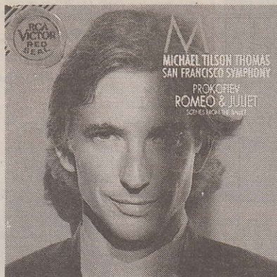
Michael Tilson Thomas